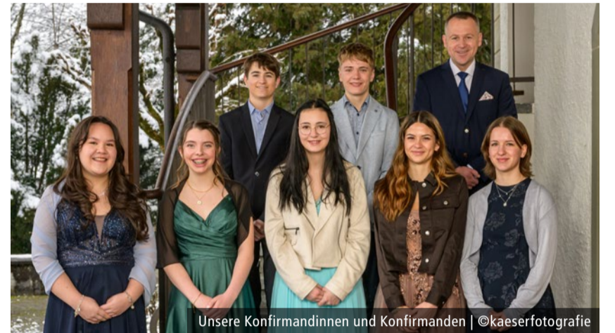
Unsere Konfirmandinnen und Konfirmanden

Die Kirchgemeinde Dürrenroth verfügt über eine Hilfskasse für Menschen, die in Notlagen geraten. Melden Sie sich in einer Notlage direkt beim Pfarrer.