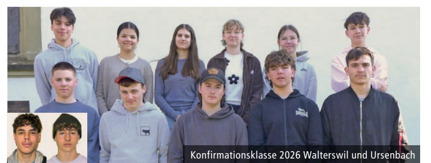
Konfirmationsklasse 2026 Walterswil und Ursenbach

Euer Herz soll sich freuen und eure Freude soll niemand von euch nehmen. Joh. 16, 22