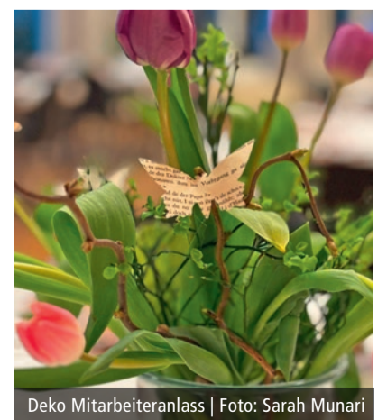
Deko Mitarbeiteranlass